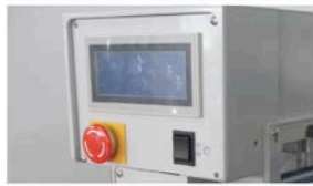
SPS-Steuerung mit Touch Screen Bedienfeld