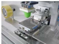
Klischeebeweger (Tamponreinigung darunter)