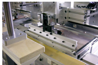
Offenes Farbbecken, 300 x 100 mm