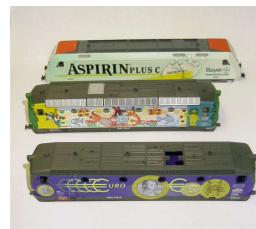
Druckbeispiele bei Eisenbahnmodellen