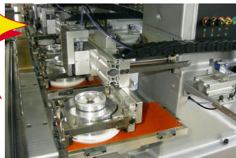
Farbnapf CMIC ø 130 mm

Offenes und geschlossenes Farbsystem gleichzeitig einsetzbar.