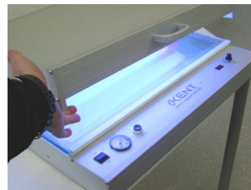
BGV 520 - Belichtungsvorgang