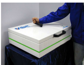
Auswaschen mit Kurbelwascher