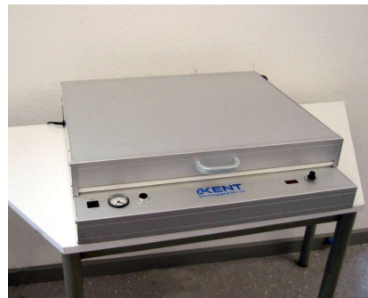
Belichtungsgerät BGV 520

520x390 mm 220V/50Hz ca. 225 W 625x605 mm 140 mm