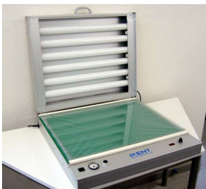
BGV 520 - UV Röhren