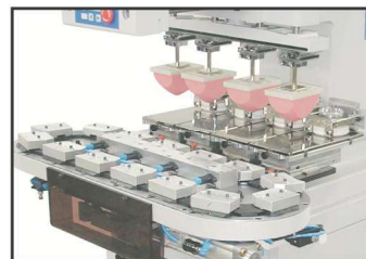
2-5 Farben Carreetisch